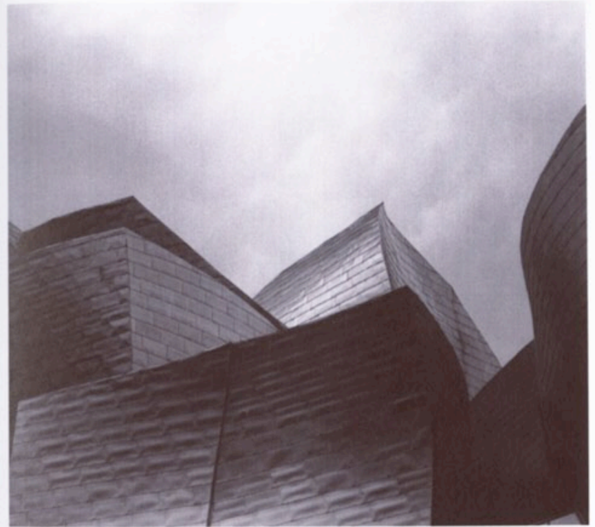
Guggenheim Museum Bilbao, Digitaler C-Print auf Alu-Dibond, 24 x 24 cm, 2003. Auflage 5 + 2 AP. Preis der 3-teiligen Serie 400,-