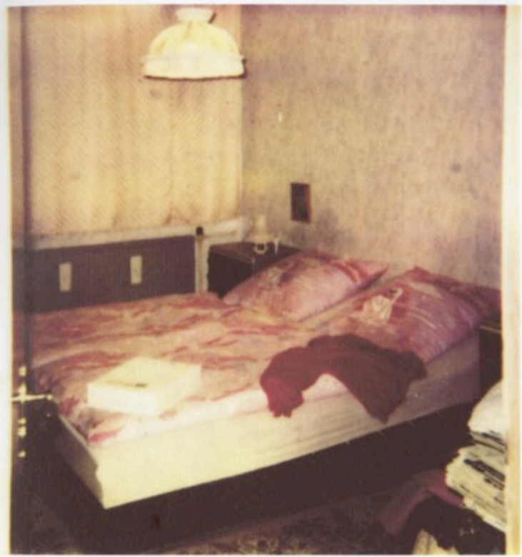
Dormitory, Digitaler C-Print auf Alu-Dibond, 24 x 24 cm, 2005. Auflage 5 + 2 AP. Preis 150,-