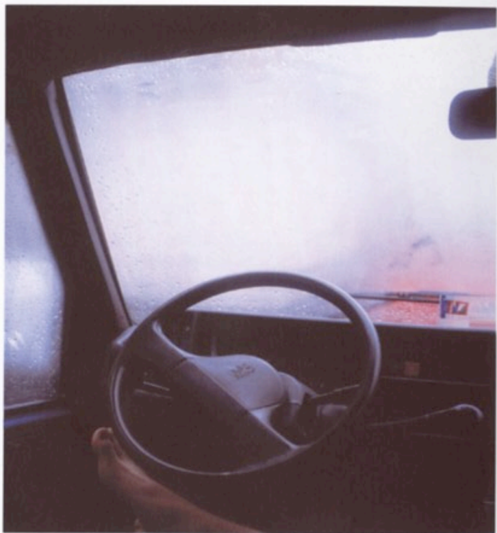
J5, Digitaler C-Print auf Alu-Dibond, 24 x 24 cm, 2003. Auflage 5 + 2 AP. Preis 150,-