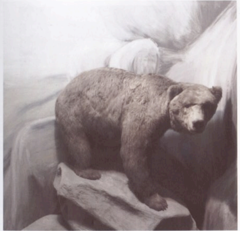
Braunbär, Aus der 6-teiligen Serie NKM, Digitaler C-Print auf Alu-Dibond, 49 x 49 cm, 2005. Auflage 7 + 2 AP. Preis der Serie 1200,- Einzelstück 300,-