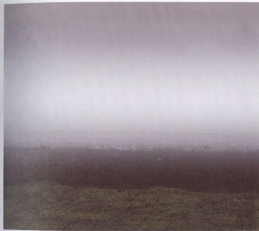
Feld, Digitaler C-Print auf Alu-Dibond, 49 x 49 cm, 2006. Auflage 1 + 1 AP. Preis 500,-