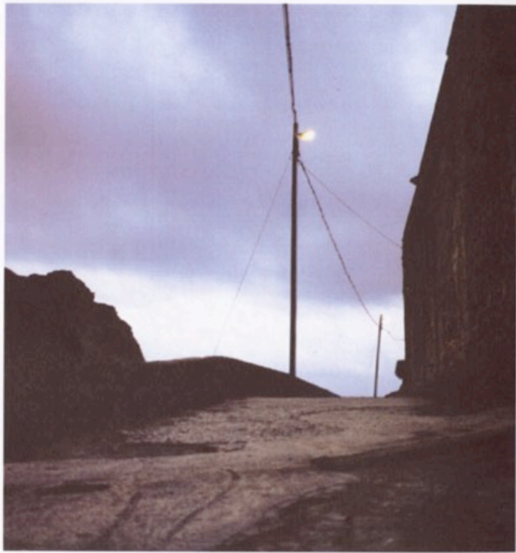
Morgen, Digitaler C-Print auf Alu-Dibond, 24 x 24 cm, 2003. Auflage 5 + 2 AP. Preis 150,-