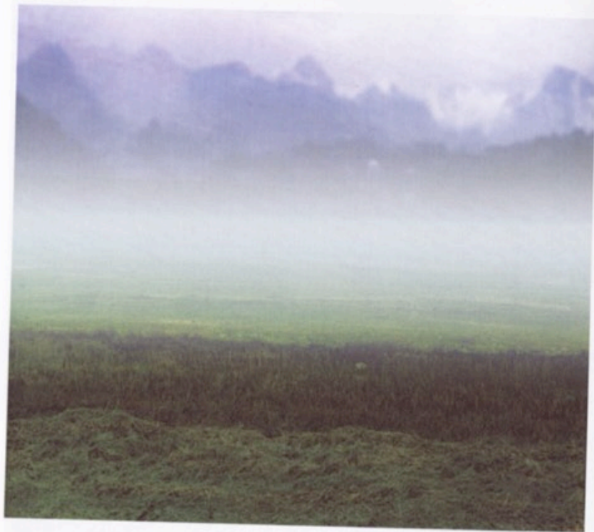
Feld, Digitaler C-Print auf Alu-Dibond, 49 x 49 cm, 2006. Auflage 1 + 1 AP. Preis 500,-