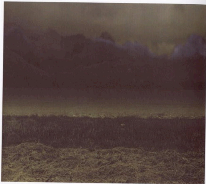
Feld, Digitaler C-Print auf Alu-Dibond, 49 x 49 cm, 2006. Auflage 1 + 1 AP. Preis 500,-