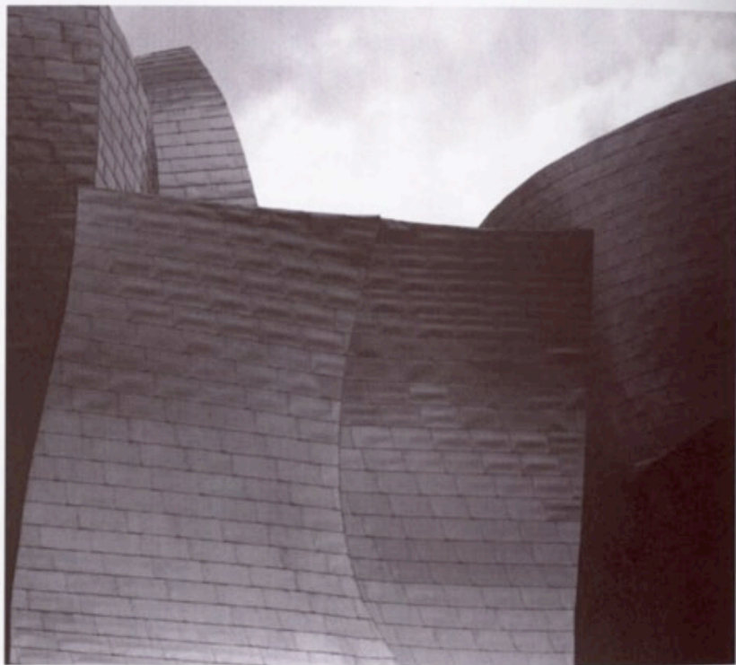
Guggenheim Museum Bilbao, Digitaler C-Print auf Alu-Dibond, 24 x 24 cm, 2003. Auflage 5 + 2 AP. Preis der 3-teiligen Serie 400,-