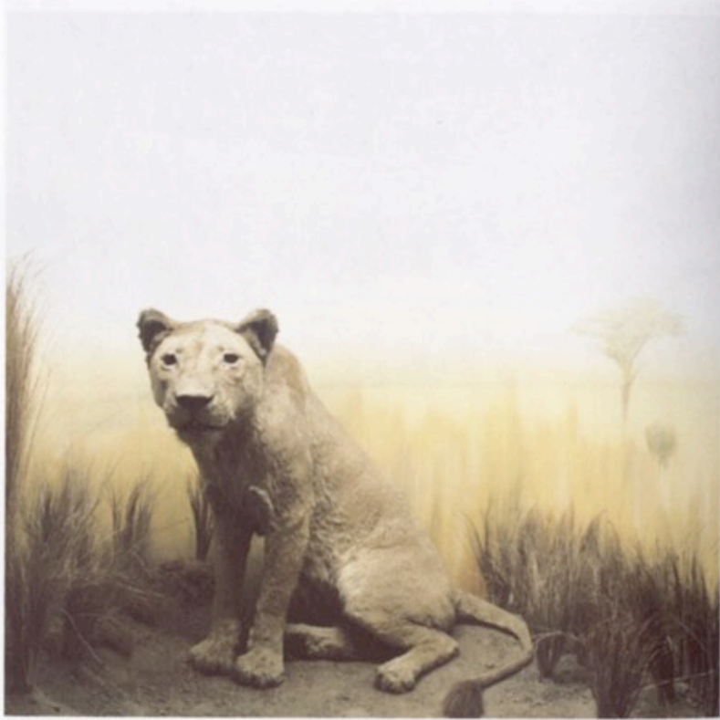
Löwin, Aus der 6-teiligen Serie NKM, Digitaler C-Print auf Alu-Dibond, 49 x 49 cm, 2005. Auflage 7 + 2 AP. Preis der Serie 1200,- Einzelstück 300,-