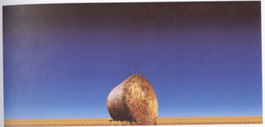
Hru, Digitaler C-Print auf Alu-Dibond, 21 x 30 cm, 2004. Auflage 5 + 1 AP. Preis 200,-